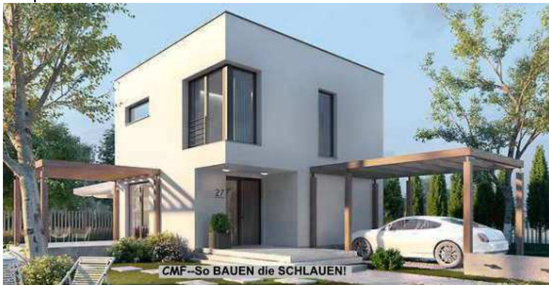
Foto Perspektive 1

— Im Standard: einfarbige Putzfassade, Bemusterung nach Farbskala— —KEINE Luftbalkenkonstruktionen im Standard— Abbildungen zeigen weitere Sonderleistungen —