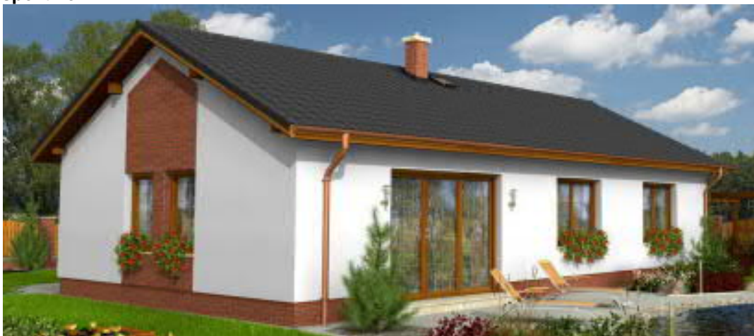
Foto Perspektive 2

— Im Standard einfarbige Putzfassade, Bemusterung nach Farbskala— — Abbildungen zeigen Sonderleistungen —