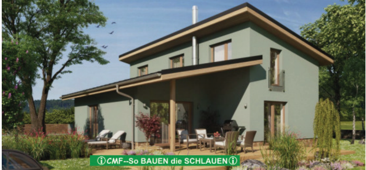
Foto Perspektive 1

Haus des Monats APRIL/2019 Auch mit AM 9,82 X 11,63 m lieferbar!