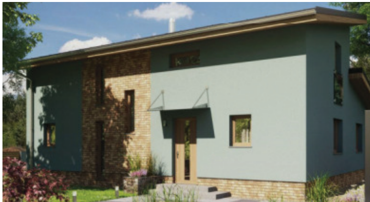
Foto Perspektive 2

Daten Haus .CEF 153 SEVILLA: — Viel Haus auf mit Stil —