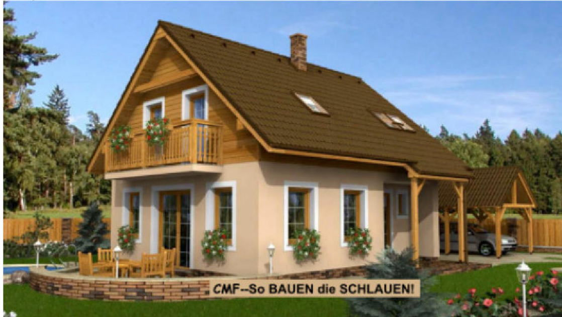
Foto Perspektive 1

— Im Standard einfarbige Putzfassade, Bemusterung nach Farbskala— — Abbildungen zeigen Sonderleistungen—