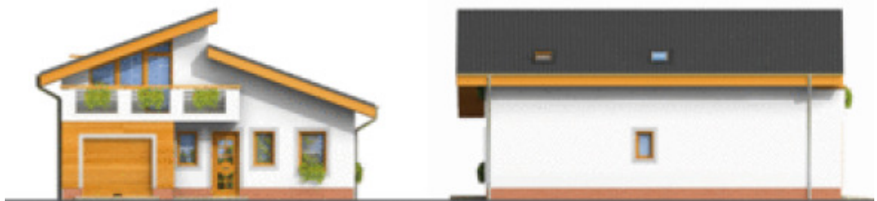
Putzfarbe nach Farbskala