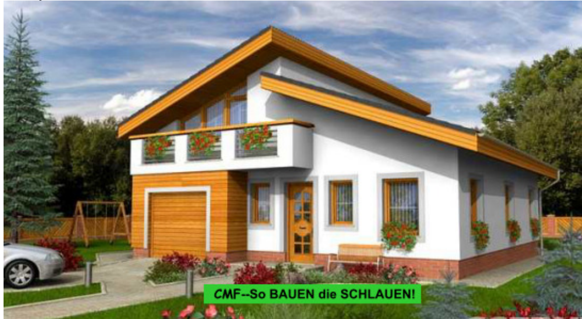
Foto Perspektive 1

— Im Standard einfarbige Putzfassade, Bemusterung nach Farbskala— — Abbildungen zeigen Sonderleistungen—