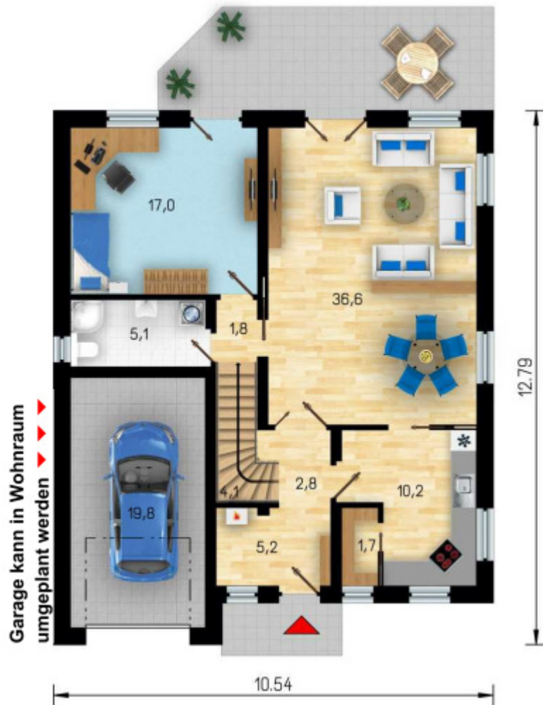
Erdgeschoss mit ca. 104 m 2 Wohn- Nutzfläche