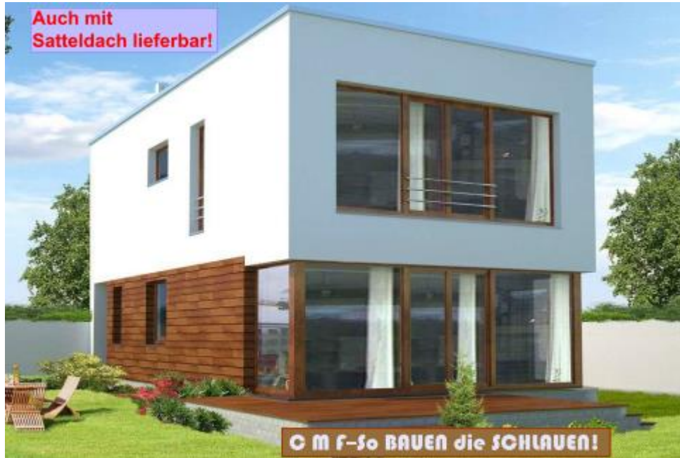
Foto Perspektive 1

— Im Standard einfarbige Putzfassade, Bemusterung nach Farbskala—