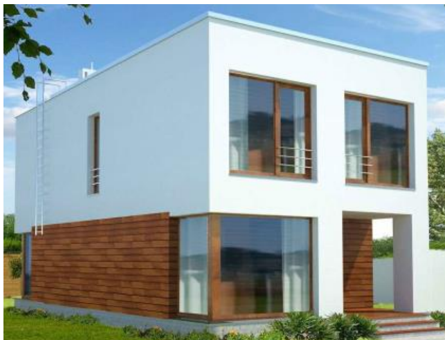
Foto Perspektive 2