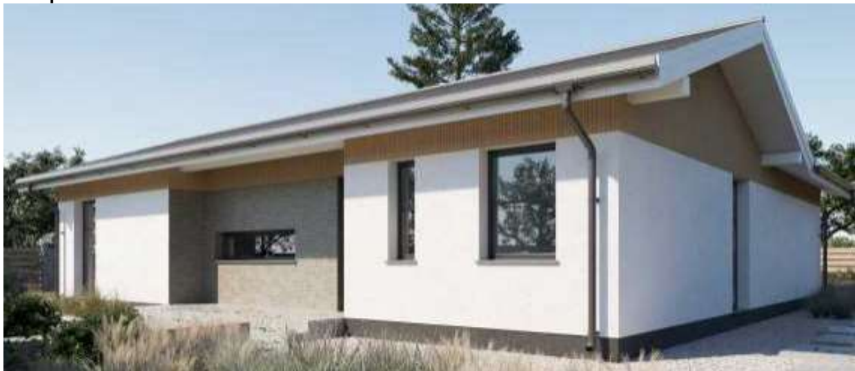
Foto Perspektive 2