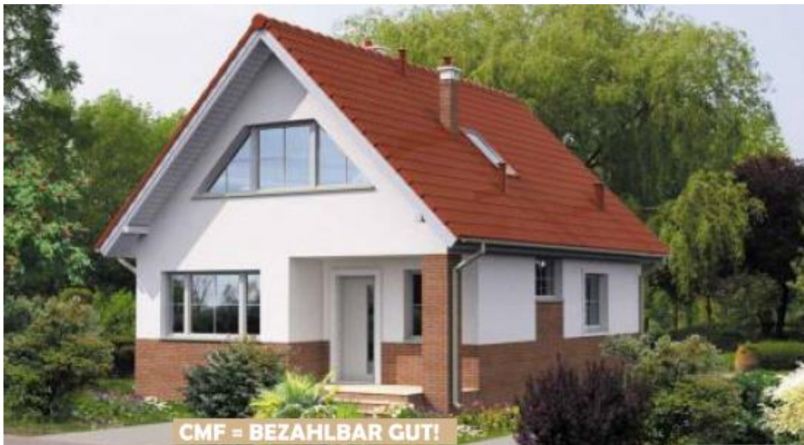
Foto Perspektive 1

— Im Standard einfarbige Putzfassade, Bemusterung nach Farbskala — — Abbildungen zeigen Sonderleistungen —