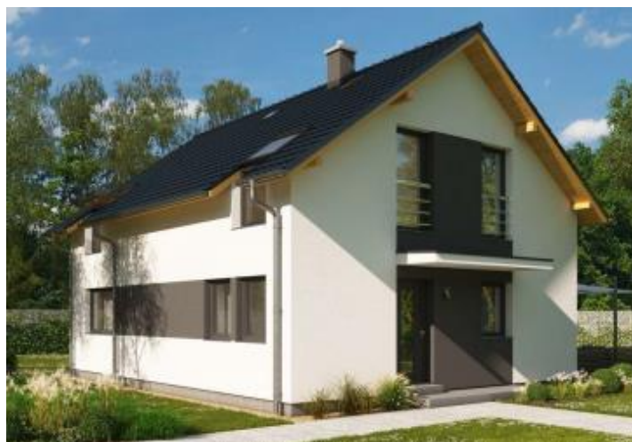
Putzfarbe nach Farbskala