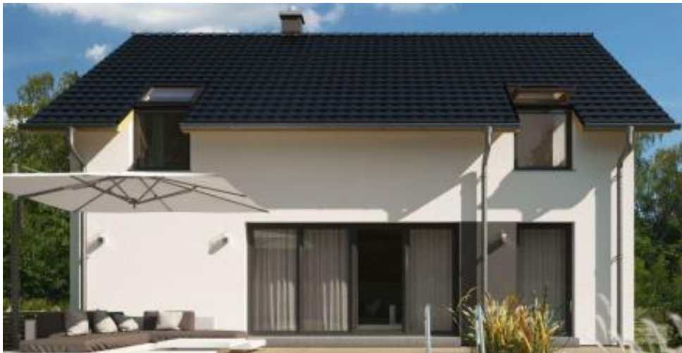
Putzfarbe nach Farbskala