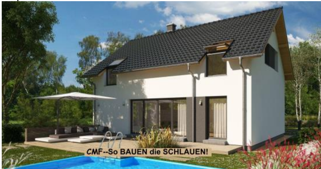
Foto Perspektive 1

— Im Standard einfarbige Putzfassade, Bemusterung nach Farbskala— — Abbildungen zeigen Sonderleistungen —