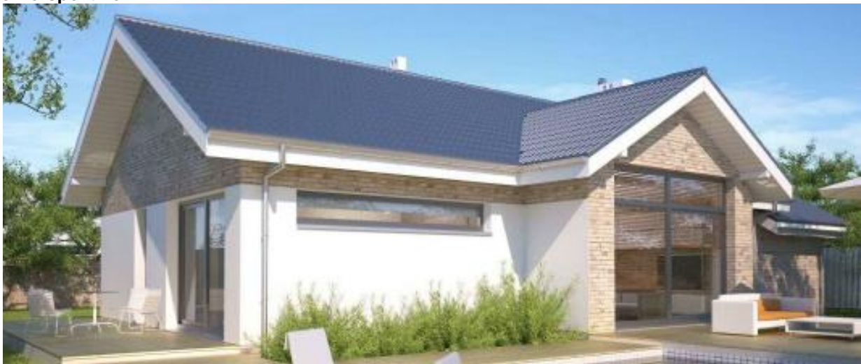
Foto Perspektive 2