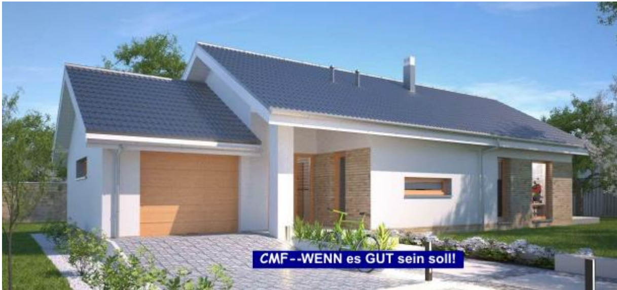
Foto Perspektive 1

— Im Standard einfarbige Putzfassade, Bemusterung nach Farbskala—