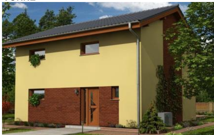
Putzfarbe nach Farbskala