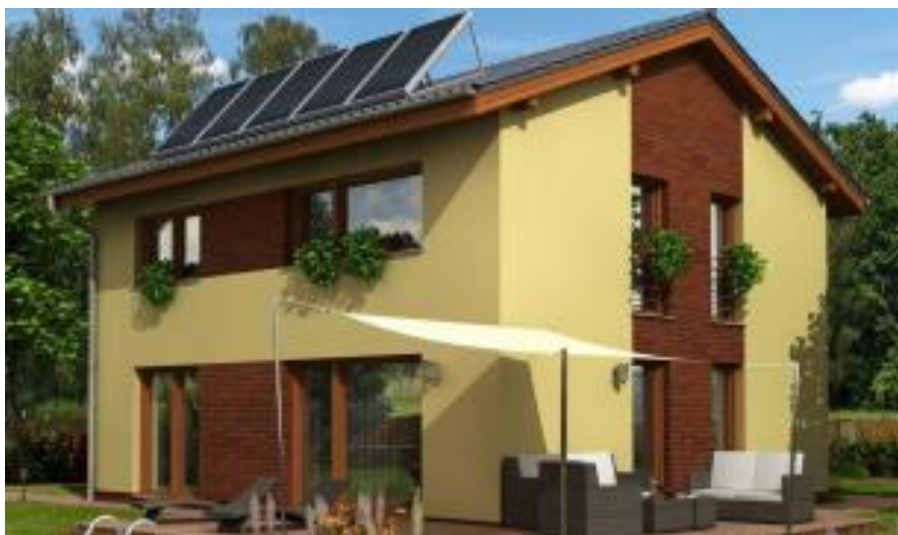
Putzfarbe nach Farbskala