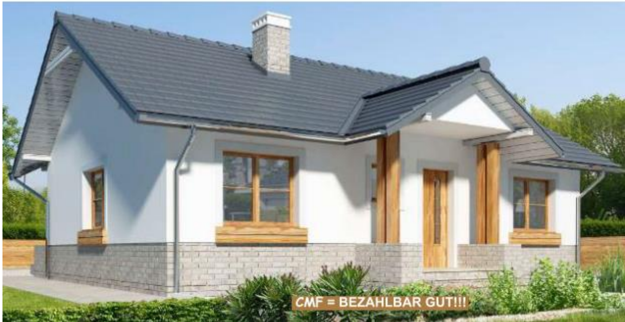
Foto Perspektive 1

— Im Standard einfarbige Putzfassade, Bemusterung nach Farbskala— — Abbildungen zeigen Sonderleistungen —