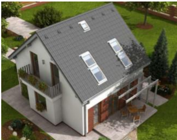
Foto Perspektive 2

— Im Standard einfarbige Putzfassade, Bemusterung nach Farbskala— — Abbildungen zeigen Sonderleistungen —