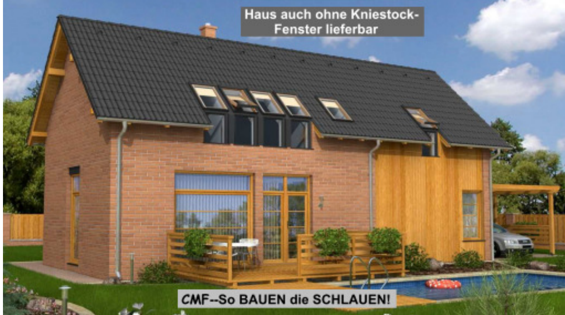
— Im Standard einfarbige Putzfassade, Bemusterung nach Farbskala— — Abbildungen zeigen Sonderleistungen—