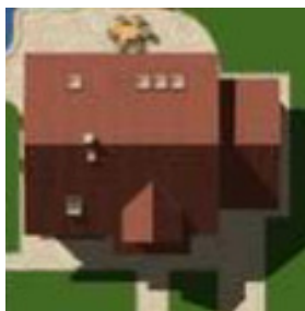
Putzfarbe nach Farbskala