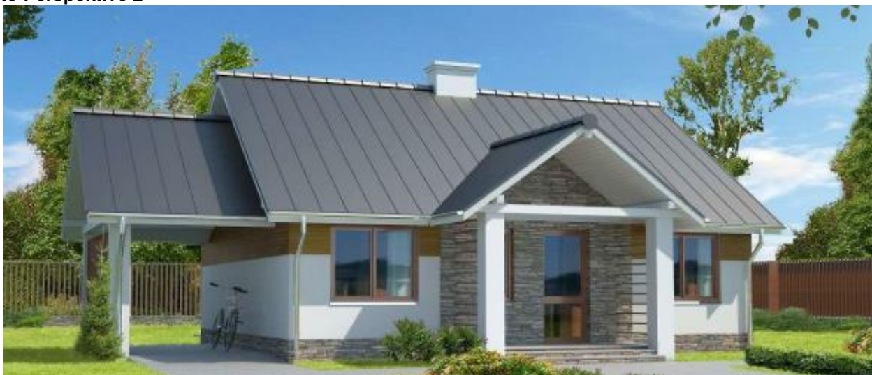
Foto Perspektive 2

— Daten Haus CRB 83 LISA — L*W*O*W — inkl. Carport —