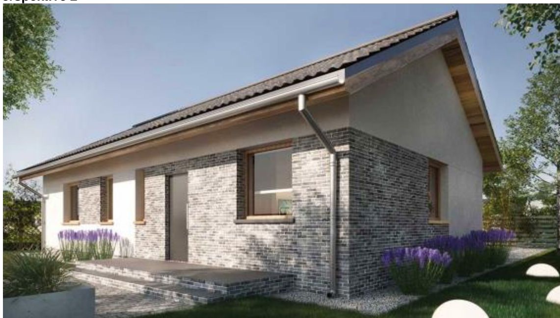
Foto Perspektive 2