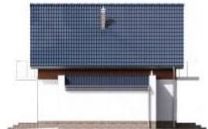
Putzfarbe nach Farbskala