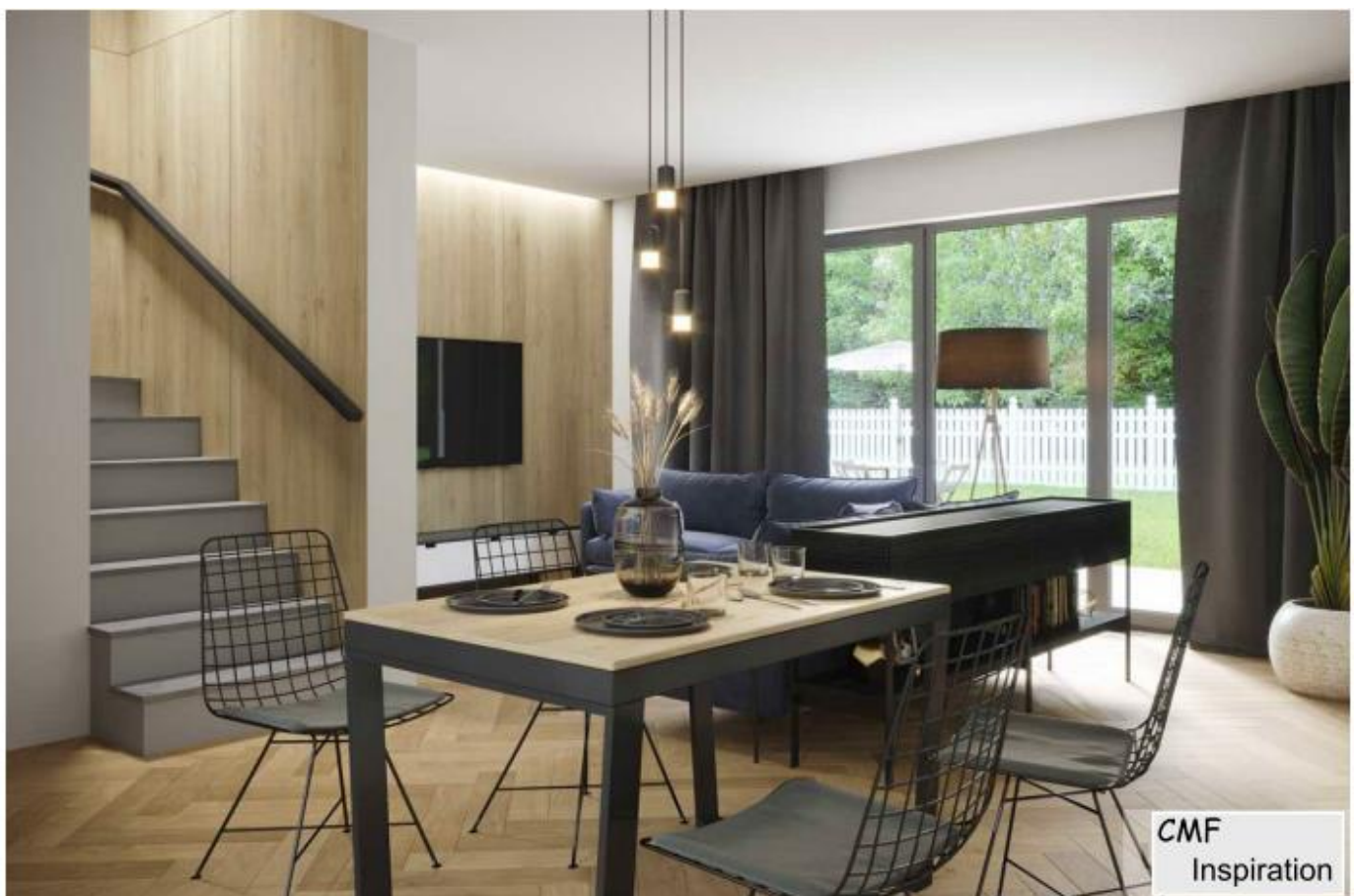
Foto zeigt eine mögliche Innengestaltung, die aber nicht Standard bzw. Angebotsrelevant ist.

Blick ins mögliche Innere, hier Raum 1.4